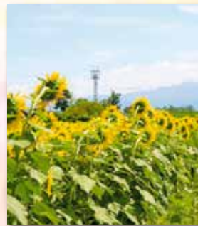
ひまわりの背中 (6年)