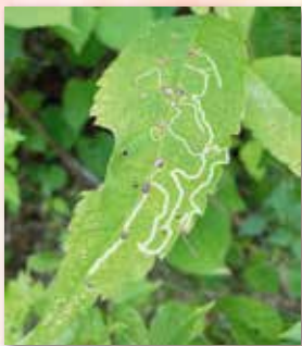
はっぱのめいろ (1年)

・ふだんにげなく見ている風景や虫たちをじっくりと見ることができました。思わず笑ってしまったり、驚いたり、写真からもいろいろな発見があり、心がきれいになりました。