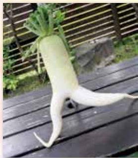
今にも走りそうな大根 (3年)