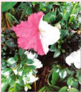
ふしぎなつつじ (2年)