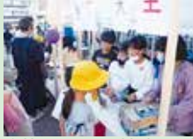
駄菓子屋での接客体験

学年ごとに地域に関わる探究課題を設定し、解決を通して、人々の努力や思いを理解し、感じたこと、考えたことを発信した。