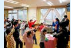
なかよし活動の様子