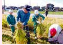
刈り取った稲の結び方を学ぶ

多様な体験活動を教育課程に位置付け、全校児童で体験する形から低・中・高学年の少人数での主体的な学びの推進を図った。