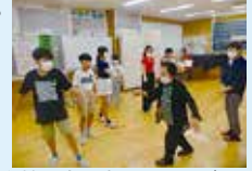
女性の会の方との踊りづくり

創校150周年。100周年に児童が作った「新奥田音頭」を今の奥田のよさを取り入れた「令和奥田音頭」に作り替える活動に取り組んだ。