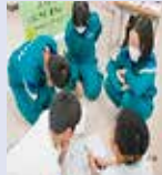
「150周年プロジェクト」 企画会議