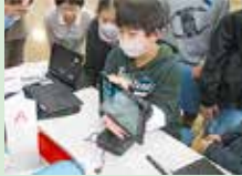
台湾の小学生に滑川市の特色を紹介する