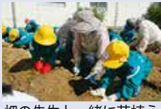
畑の先生と一緒に苗植え

今まで当たり前に行ってきた活動を、教師と子供たちが一緒になって「地域とのつながり」という視点で見直し取り組んだ。