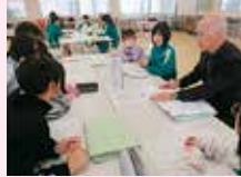
安田城趾の史跡価値について考える