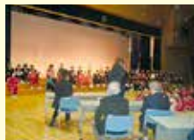
郷土の先人からの学びを発表する