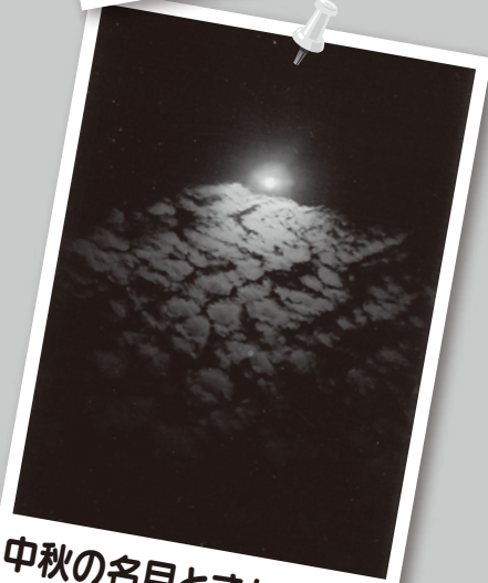
中秋の名月ときれいな雲 (4年)