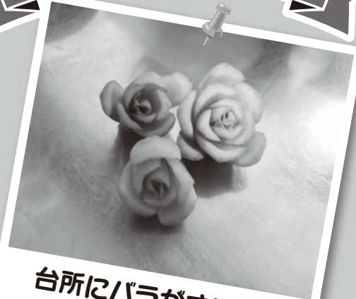
台所にバラがさいた! (6年)