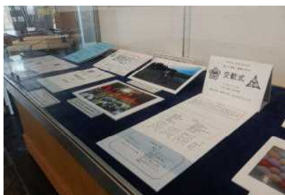
【上】「疎開生活の実際」 (疎開準備・富山へ) (1日の暮らし・学びと食事) (満たされないからだと心) (「600日の絵日記」福光にて) 【左】「今もつづく学校間交流」 (富・三成小学校、射・金山小学校)