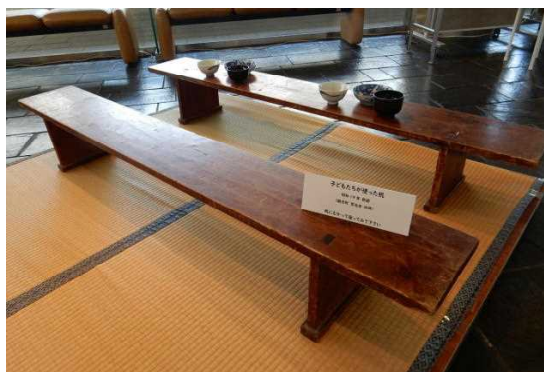
「当時、子どもたちが使っていた机」 (昭和19年新調、朝日町・常光寺 所蔵)