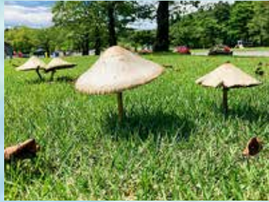
暑いですね、きのこパラソルをどうぞ (3年)