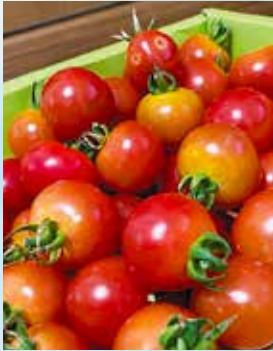
あっ・・・いた!!! (2年)