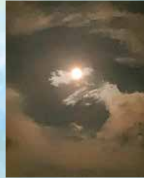
夜空にティラノ現る! (6年)