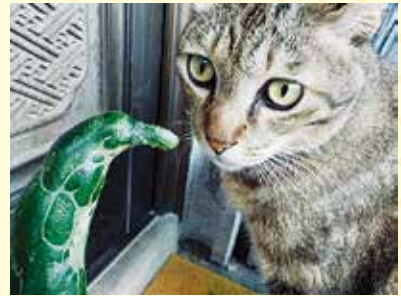
「きゅうりペンギンあらわれる! ねこビックリ」【3年】