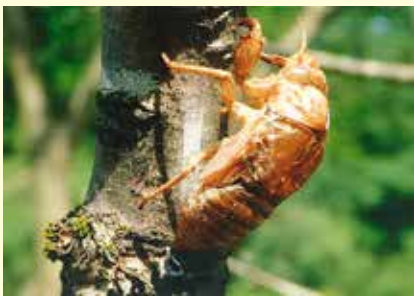
「少ししか生きられないセミの 大事な成長」【4年】