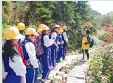
弥陀ヶ原湿原散策

地域の自然や人に積極的に目を向け、自ら課題を見つけ、主体的に問題解決に取り組み、自己の生き方を考えようとする児童の育成