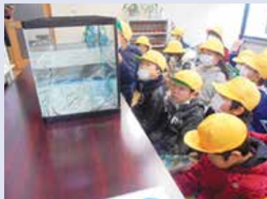
サクラマスの生態を学ぶ