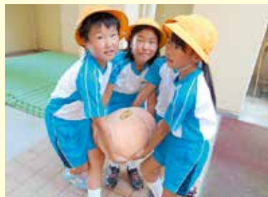
ジャンボカボチャの栽培