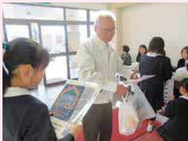
社会福祉センターまつり