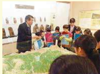
大山歴史民俗資料館見学

地域の人や自然、文化に積極 的に関わり、地域のよさと伝統 を大切にしようとする子供を育 てる