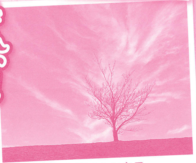
木と雲のシンクロ