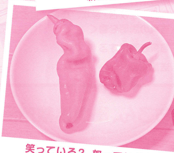
笑っている？ 怒っている？

がっこう がつしゅう ひ せいかつ なか きみ め とお はっけん しぜんかい 学校での学習や日ごろの生活の中から、君たちの目を通して発見しためずらしい自然界 どうぶつ こんちゅう しょくぶつ てんき ふうけい ばめん うつ しゃしん おく ま (動物、昆虫、植物、天気、風景など)の場面を写した写真を送ってください。待っています。