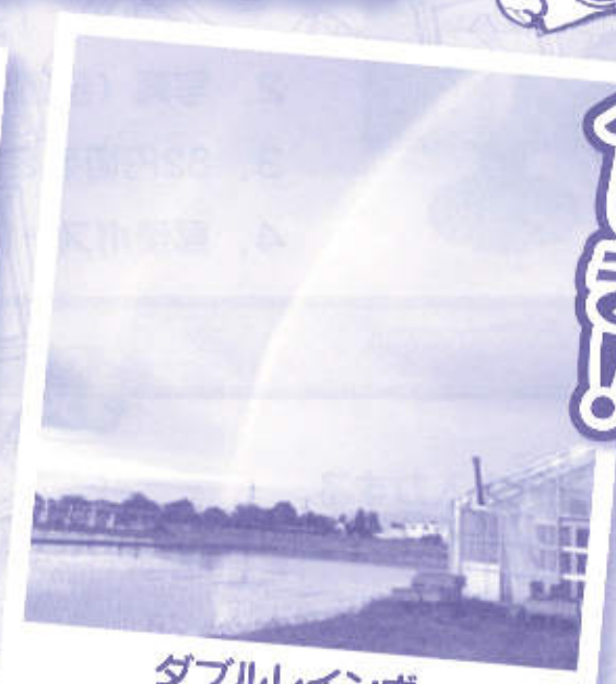
ダブルレインボー