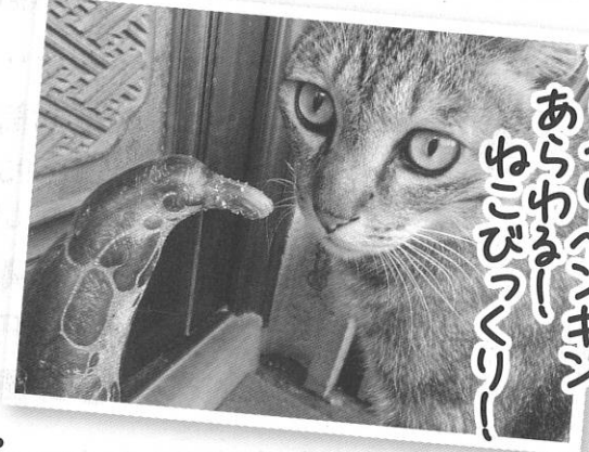
きゅうりペンギン あらゆるー ねこびつくりー